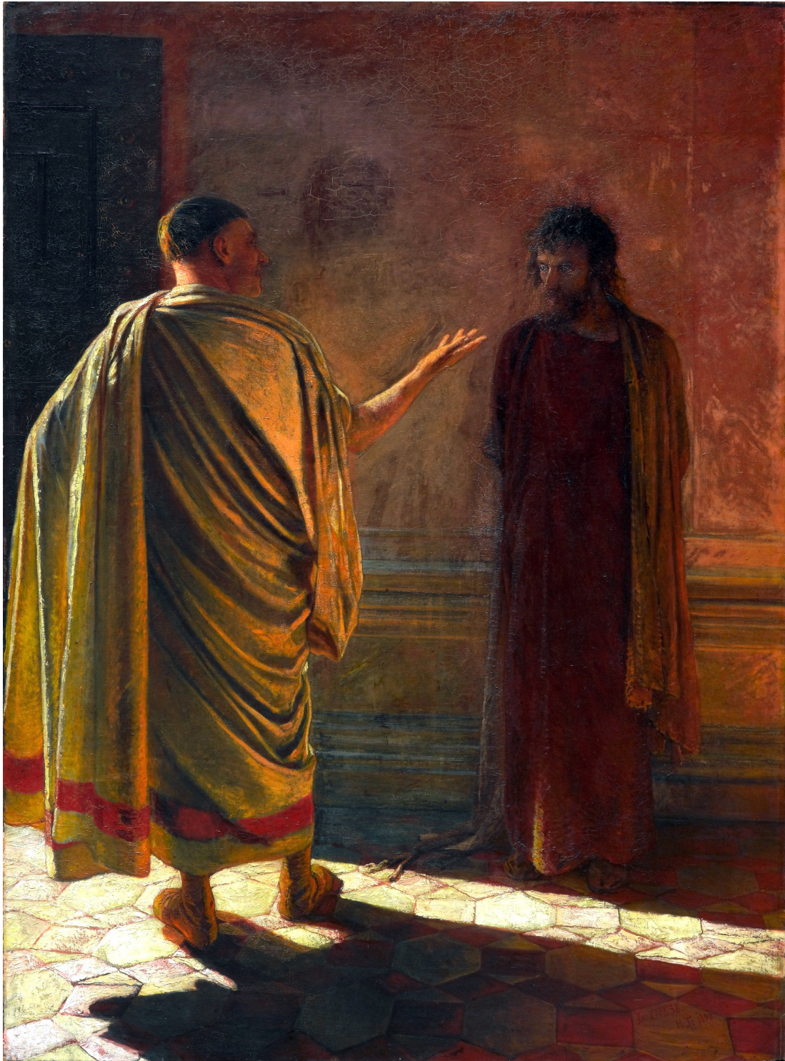
Abb. 7: Nikolei Ge (1831-1894): Was ist Wahrheit? Christus vor Pilatus. Öl auf Leinwand. 1890. Tretyakov Gallery, Moskau.