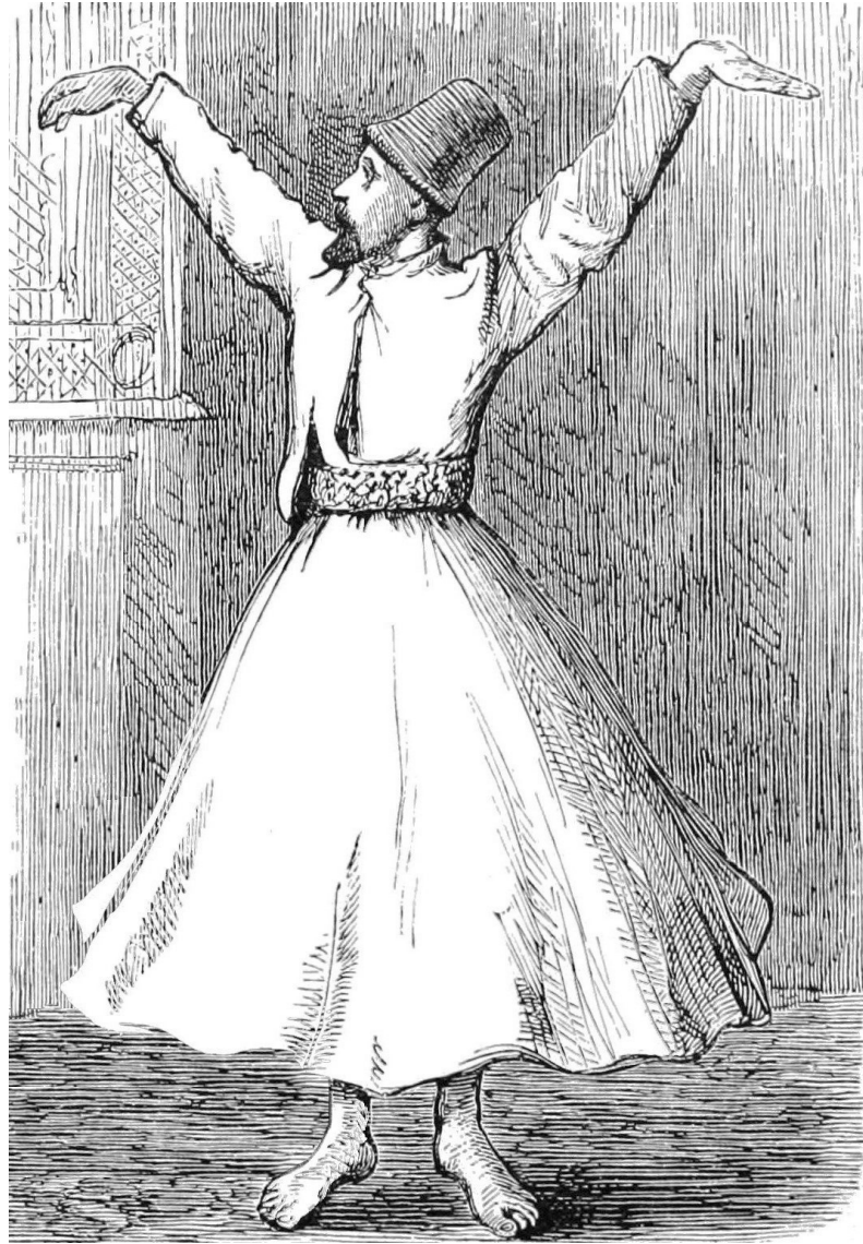
Abb. 13: Illustrator von Appleton & Company: Dancing Dervishes (Ausschnitt). Druckgrafik. In: Vance, Lee. J. (1892): The Evolution of Dancing. In: Youmans, Edward L. (Hrsg.): The Popular Science Monthly 41. S. 739–756. Hier: S. 752, Fig. 9.