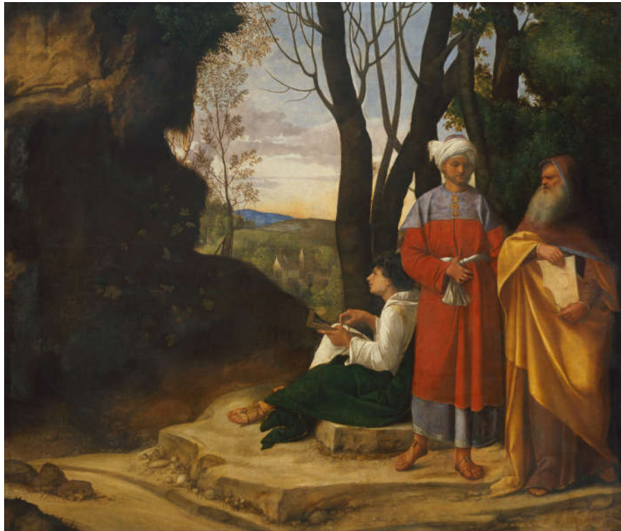
Abb. 10: Giorgione (1478–1510): »Die drei Philosophen«. Öl auf Leinwand. 125,5 × 146,2 cm (links stark beschnitten). Ca. 1508–1509. Kunsthistorisches Museum. Wien.

Bis heute ist die Interpretation des Bildes hoch kontrovers; gleichviel, wie die drei Gestalten konkret identifiziert werden, es scheint, als repräsentierten sie Antike und westliches wie islamisches Mittelalter.