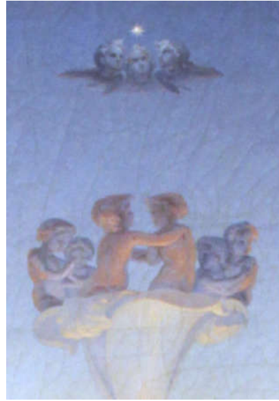
Abb. 9: Phillip Otto Runge (1777–1810): Der Morgen (kleiner Auszug), 1808. Öl auf Leinwand. Größe des vollständigen Bildes: 109 × 85,5 cm. Hamburger Kunsthalle.